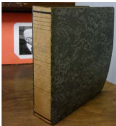
fig.11 – Contenitore del Rotor