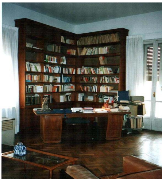
fig.2 – Stanza Studio Bobbio