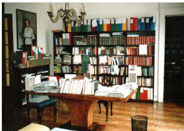
fig.5 – Stanza Laboratorio