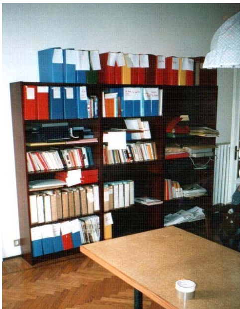
fig.6 – Stanza Archivio