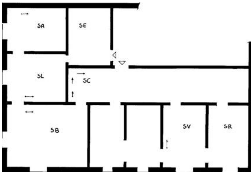
fig.1 – Pianta dell'appartamento