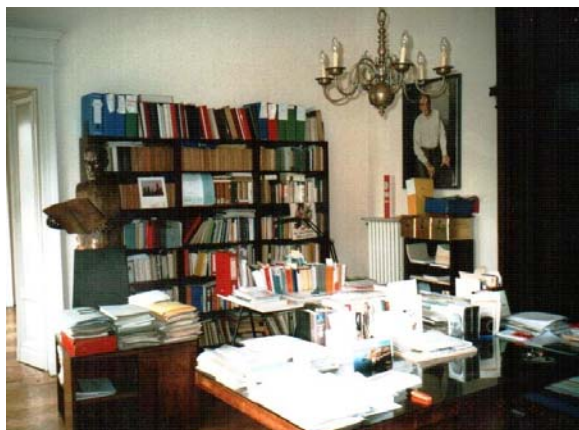
fig.4 – Stanza Laboratorio