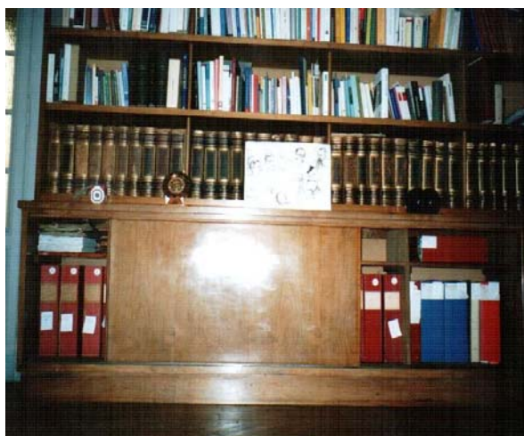
fig.3 – Stanza Studio Bobbio, particolare