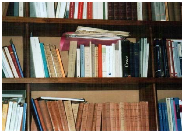
fig.9 – Particolare di fascicolo su scaffale