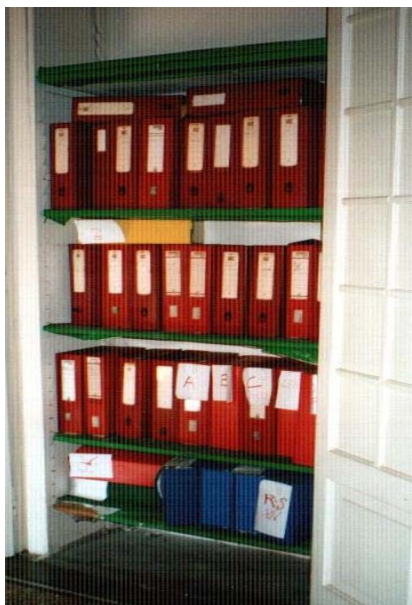
fig.7 – Stanza Epistolario

Per le caratteristiche archivistiche specifiche di ciascuna Stanza si rimanda alla descrizione presente in inventario e nelle schede informatizzate (nel campo Contenuto).